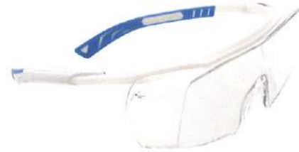
セーフティアイウェア MODEL-5X7