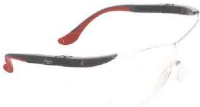
セーフティアイウェア MODEL-507