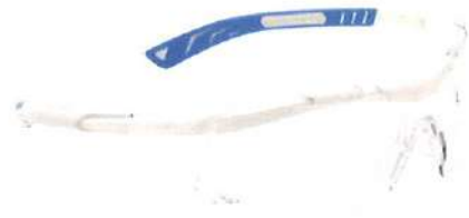
セーフティアイウェア MODEL-5X6