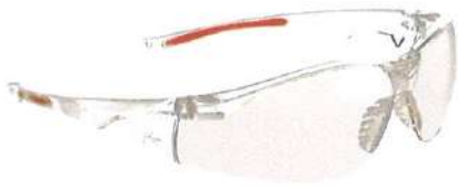
セーフティアイウェア MODEL-513