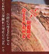
※1 タヒボの樹皮を粉末にした状態で乾燥させた厚さが7mmほどの部分